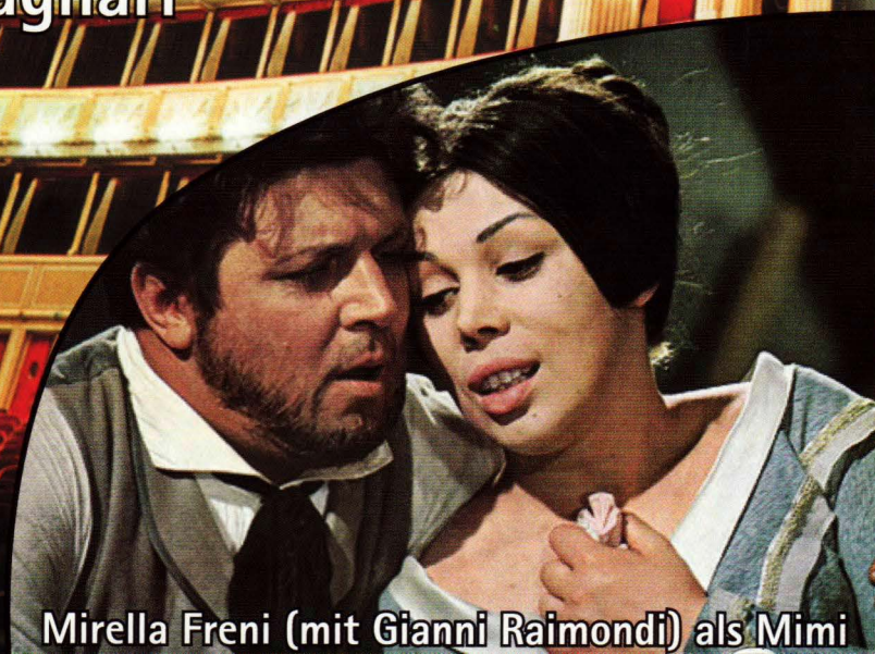
Mirella Freni (mit Gianni Raimondi) als Mimi